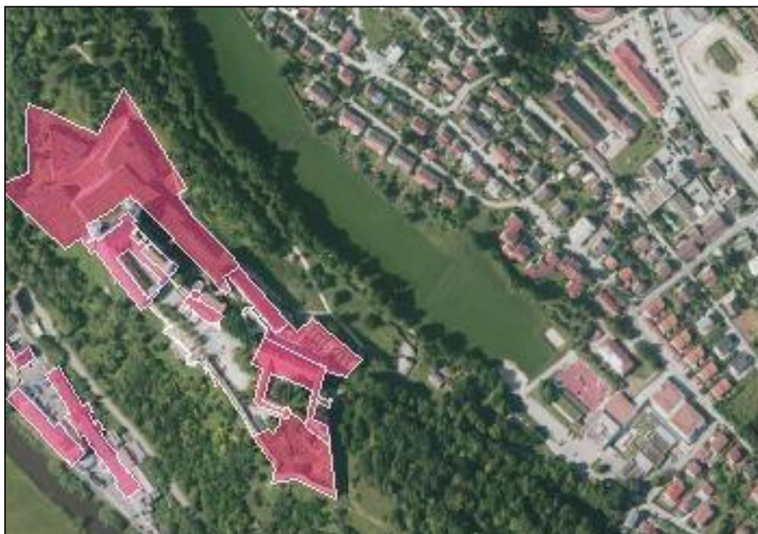
Abbildung 4: Darstellung des Baudenkmals Willibaldsburg 2