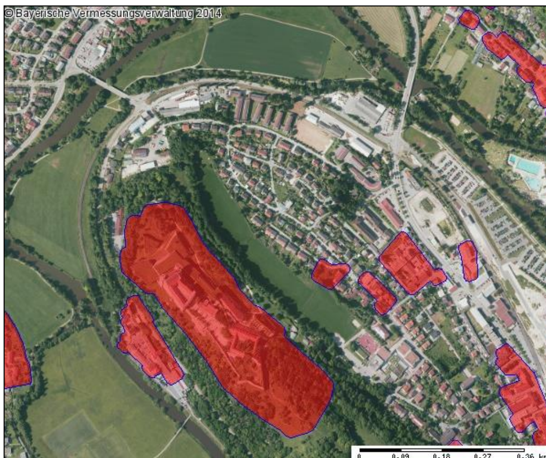
Abbildung 3: Bodendenkmäler im Plangebiet