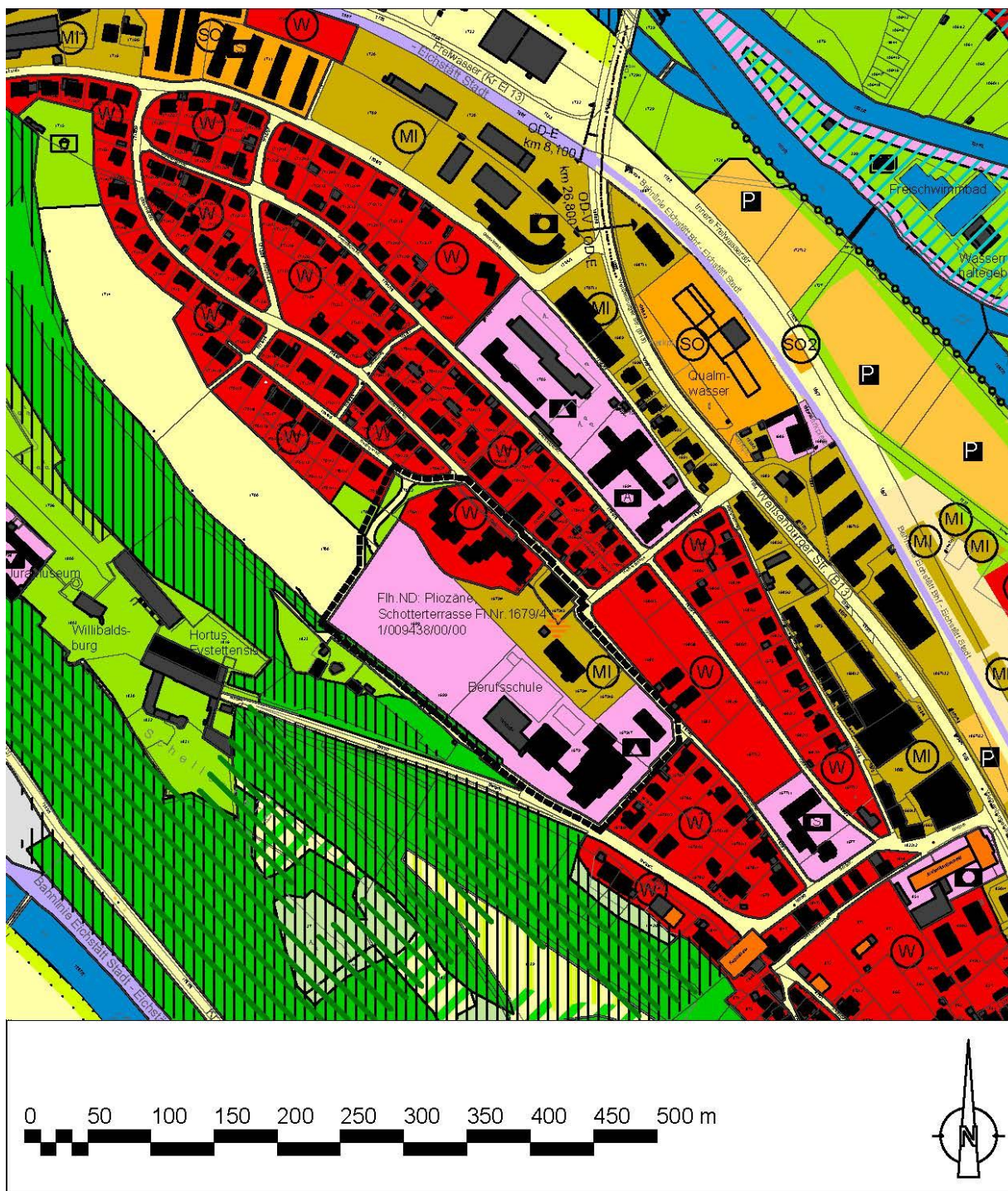
Abbildung 1: Ausschnitt zur Änderung des Flächennutzungsplans im Maßstab 1:5.000

Im Zuge der vorliegenden 1. Änderung des Bebauungsplans Nr. 63 werden keine weiteren Anpassungen des Flächennutzungsplans der Stadt Eichstätt erforderlich.