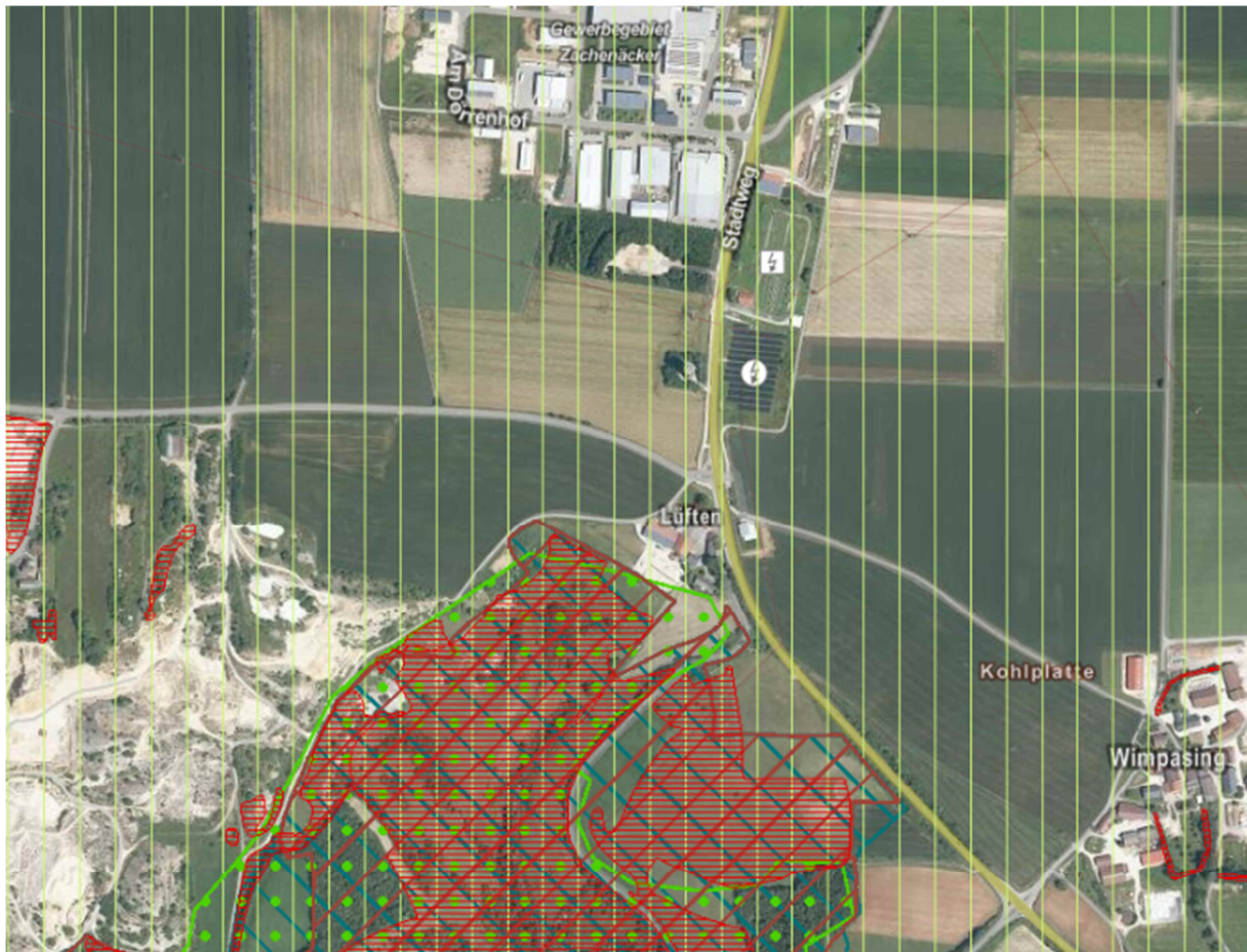
Abbildung 3: Luftbild des Änderungsbereichs mit Schutzgebietsabgrenzungen und Biotopkartierung (Bayern-Atlas 28.06.2017) (hellgrüne senkrechte Schraffur = Naturpark grünes Punktraster = Landschaftsschutzgebiet rotbraune Schraffur = FFH-Gebiet blaugrüne Schraffur = Vogelschutzgebiet rote, enge Schraffur = Biotopkartierung)