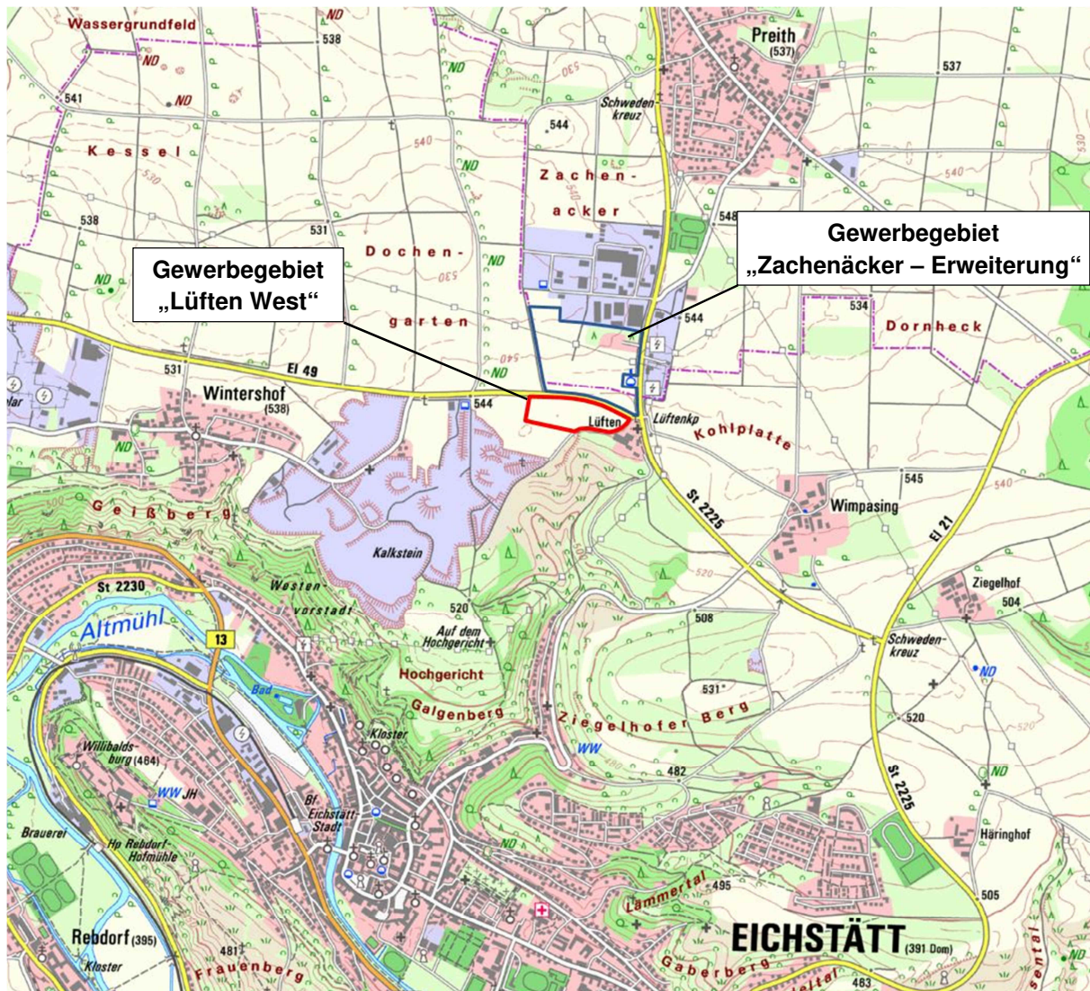
Abbildung 1: Lage des geplanten Gewerbegebietes nördlich von Eichstätt (Ausschnitt aus der TK25, ohne Maßstab)