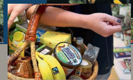
Info- und Erlebnisveranstaltung „Lust und Fair“ Seite 4