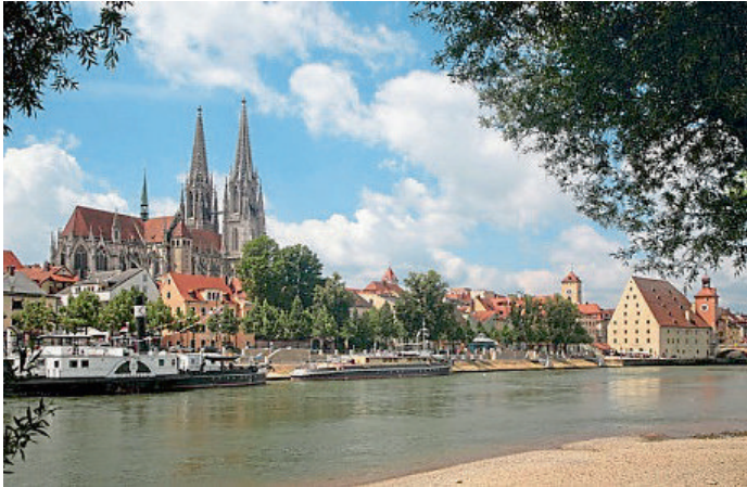
Eines der Aushängeschilder Regensburgs ist neben der Donau vor allem die historische Altstadt mit dem gotischen Dom und der Steinernen Brücke.

Direkt vor den Toren des Naturpark Altmühltal wartet die UNESCO-Welterbe-Stadt Regensburg auf Entdeckung. Von 17. Mai bis Ende September 2019 startet jeden Freitag ein komfortabler Reisebus, der über die Stationen Eichstätt, Walting, Kipfenberg, Kinding, Greding, Beilngries, Dietfurt und Riedenburg Regensburg ansteuert. Während der Busfahrt durch das Altmühltal erfahren die Gäste Wissenswertes über Natur, Kultur und Geschichte des Naturparks. In Regensburg schlendern die Teilnehmer durch die mittelalterlichen Gässchen, bewundern Sehenswürdigkeiten wie den gotischen Dom und die Steinernen Brücke, kehren in der Wurstkuchl ein und erreichen schließlich den Donaustrand. Dort geht es an Bord eines Ausflugsschiffs. Auf der Fahrt zur Walhalla, wo eine Begegnung mit Persönlichkeiten aus Kultur und Geschichte wartet, lassen die Passagiere sich an Bord entspannt treiben. Die Rückkehr ist je nach Ausstiegsort zwischen 17 und 18.30 Uhr.