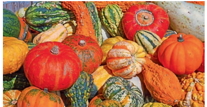
Im Herbst stehen unter anderem Kürbisse groß auf dem Speiseplan.

Vom 21. September bis zum 13. Oktober 2019 geht es „herbstlich“ zu in Eichstätts Gastronomieküchen – mit feinen Wildspezialitäten, leckeren Kürbiskreationen, Schwammerl, edlem Geflügel und schmackhaften Kücherl. Denn das Projekt „Eichstätt kocht ...“, die gemeinsame Aktion ausgewählter Eichstätter Gastronomen und der Tourist-Information, geht in die nächste Runde.