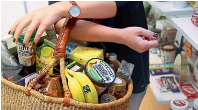
Auch in Eichstätt kann man seinen Einkaufskorb mit Fairtrade-Produkten füllen.

„Lust auf Fair“ – Kostproben und Erfahrungen rund um den fairen Handel für Einzelhändler bei KELZ Delikatessen