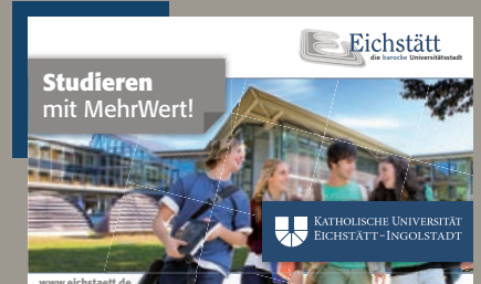
Neue Banner als Ortseingangsschilder von Eichstätt Seite 11