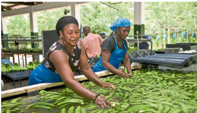
Bananen sind ein beliebtes Fairtrade-Produkt.

In Kooperation mit der Veranstaltungsreihe „Serviceoffensive Einzelhandel II“ der Standortbeauftragten der Stadt Eichstätt lädt die Steuerungsgruppe der Fairtrade-Stadt Eichstätt alle Eichstätter Einzelhändler zu einer besonderen Veranstaltung ein. Unter dem