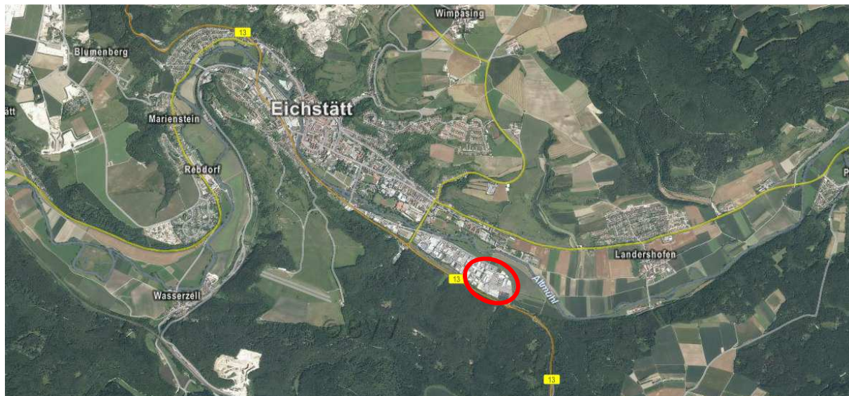
Abbildung 1 Luftbild - Verortung des Plangebiets

Der Geltungsbereich der Änderung liegt im südöstlichen Bereich des bestehenden Industrie- und Gewerbegebietes „Sollnau“ der Großen Kreisstadt Eichstätt. Das Industrie- und Gewerbegebiet ist etwa 2 Kilometer vom Siedlungskern der Stadt Eichstätt in südöstlicher Richtung entfernt. Südlich davon verläuft die Bundesstraße 13 an die das Gewerbegebiet angeschlossen ist. 500 Meter nördlich fließt die Altmühl. Die seitlich der Altmühl gelegenen Hochwassergefahrenflächen der Stufe HQ100 reichen nördlich und östlich bis an das Gewerbe- und Industriegebiet Sollnau heran.