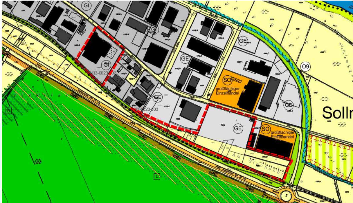
Abbildung 2 Ausschnitt des rechtskräftigen Flächennutzungsplanes für den Bereich der Änderung

Südlich angrenzend zwischen der Bundesstraße 13 und dem Rand des Gewerbegebietes liegen weitere Landwirtschaftsflächen sowie ein Fuß- und Radweg.