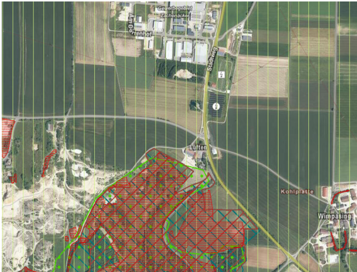
Abbildung 3: Luftbild des Änderungsbereichs mit Schutzgebietsabgrenzungen und Biotopkartierung (Bayern-Atlas 28.06.2017) (hellgrüne senkrechte Schraffur = Naturpark grünes Punktraster = Landschaftsschutzgebiet rotbraune Schraffur = FFH-Gebiet blaugrüne Schraffur = Vogelschutzgebiet rote, enge Schraffur = Biotopkartierung)

weiteren Planungsverlauf auf Ebene des Bebauungsplans abgeleitet werden. Die Artenschutzkartierung weist keine Fundpunkte im Änderungsbereich auf.