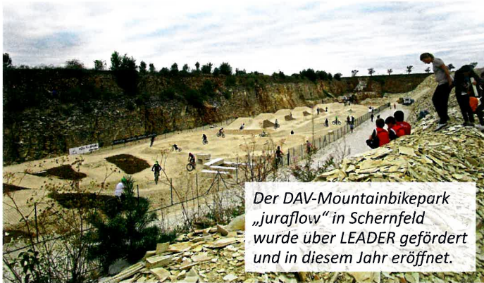
Der DAV-Mountainbikepark „juraflow“ in Schernfeld wurde über LEADER gefördert und in diesem Jahr eröffnet.

Rund fünf Jahre liegt die Gründung der Lokalen Aktionsgruppe (LAG) Altmühl-Donau nun bereits zurück. Der Verein – ein Zusammenschluss von 19 Kommunen, diversen Vereinen und Verbänden sowie Privatpersonen im südlichen Landkreis Eichstätt – wurde gegründet, um das EU-Förderprogramm LEADER in der Region umzusetzen.