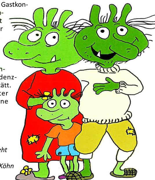
Im Kinderstück geht es um die Olchis.

Karten gibt es an den bekannten Vorverkaufsstellen, online unter residenzfestspiele-eichstaett.de sowie unter der Tickethotline 0651/97 90 777.