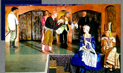
Die Residenzfestspiele 2020 Seite 8