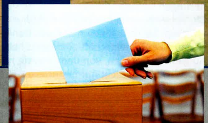
Wichtiges zur Kommunalwahlen am 15. März 2020 Seite 3