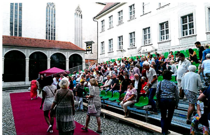
Bei den Residenzfestspielen im Innenhof der ehemaligen Fürstbischöflichen Residenz können die Besucher vier Eigenproduktionen sehen, darunter auch ein Stück für Kinder.

Die Residenzfestspiele Eichstätt im Innenhof der ehemaligen Fürstbischöflichen Residenz finden im Sommer 2020 zum zweiten Mal statt. Wie der künstlerische Leiter Dr. Marcel Krohn auf der Pressekonferenz am 21.11. bekannt gab, werden in der Zeit vom 26. Juni bis 9. August vier Eigenproduktionen zu sehen sein: Molières Komödie ‚Der eingebildete Kranke‘, die Polit-Satire ‚Make Germany great again!‘, ‚Der Großinquisitor‘ nach Fjodor Dostojewskij und für die Kinder ‚Hilfe, die Olchis kommen!‘