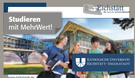
Neue Banner als Ortseingangsschilder von Eichstätt Seite 11