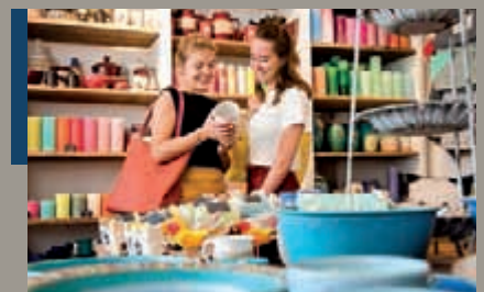
Veranstaltungsreihe „Serviceoffensive Einzelhandel“ Seite 6