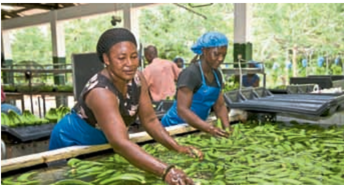
Bananen sind ein beliebtes Fairtrade-Produkt.

In Kooperation mit der Veranstaltungsreihe „Serviceoffensive Einzelhandel II“ der Standortbeauftragten der Stadt Eichstätt lädt die Steuerungsgruppe der Fairtrade-Stadt Eichstätt alle Eichstätter Einzelhändler zu einer besonderen Veranstaltung ein. Unter dem Motto „Lust auf Fair“ möchten die Fairtrade-Engagierten der Stadt