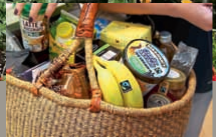
Info- und Erlebnisveranstaltung „Lust und Fair“ Seite 4