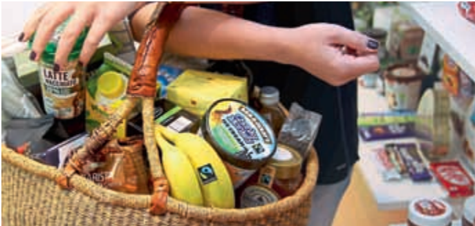
Auch in Eichstätt kann man seinen Einkaufskorb mit Fairtrade-Produkten füllen.

„Lust auf Fair“ – Kostproben und Erfahrungen rund um den fairen Handel für Einzelhändler bei KELZ Delikatessen