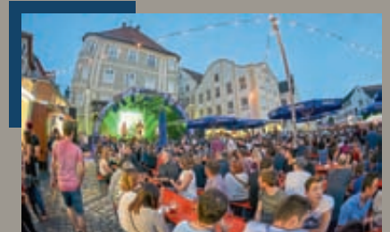
Drei Tage Musik, Kulinarik und Mitmachaktionen