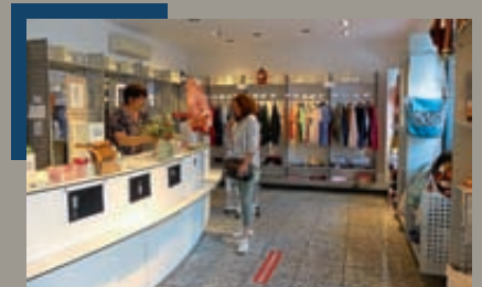
Neues LeerGut-Projekt „Handwerk. Handwerk“ am Marktplatz