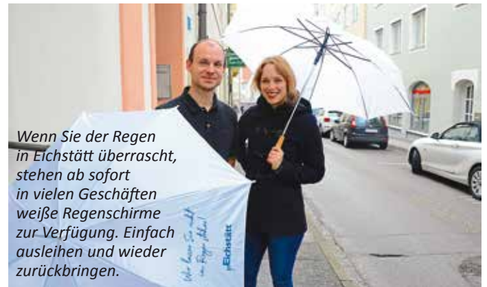
Wenn Sie der Regen in Eichstätt überrascht, stehen ab sofort in vielen Geschäften weiße Regenschirme zur Verfügung. Einfach ausleihen und wieder zurückbringen.

„Ihr Ticket zahlen wir“ ist eine Aktion, die es nicht erst seit gestern in Eichstätt gibt. In neuer Auflage und mit vielen neuen teilnehmenden Geschäften kann das Park- oder Busticket zurückerstattet wer-