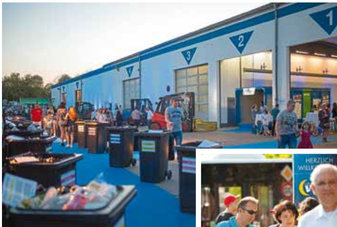
Impressionen der Langen Nacht der Unternehmen und Wissenschaft im April 2018

Nach einer äußerst erfolgreichen Auftaktveranstaltung im April 2018 plant das Regionalmanagement IRMA e.V. für den 24. Mai 2019 die Neuauflage der Langen Nacht. Vergangenes Jahr haben 20 Unternehmen und Bildungseinrichtungen aus dem Pilotraum Ingolstadt an dem Format teilgenommen und rund 6.000 Besucherinnen und Besucher aus der ganzen Region willkommen geheißen. Ganz im Sinne einer „Nacht der offenen Türen“ wird bei der Abendveranstaltung im Mai von 17 bis 24 Uhr wieder ein ganz besonderer Blick hinter die Kulissen geboten – dieses Mal auch in Eichstätt. Von Führungen, Mitmach-Aktionen bis hin zu Vorträgen ist alles dabei.