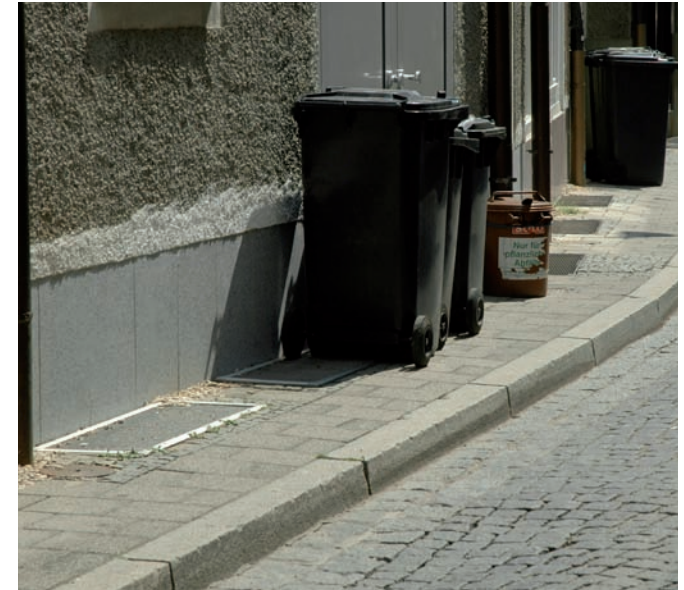
zu enge und vollgestellte Gehwege