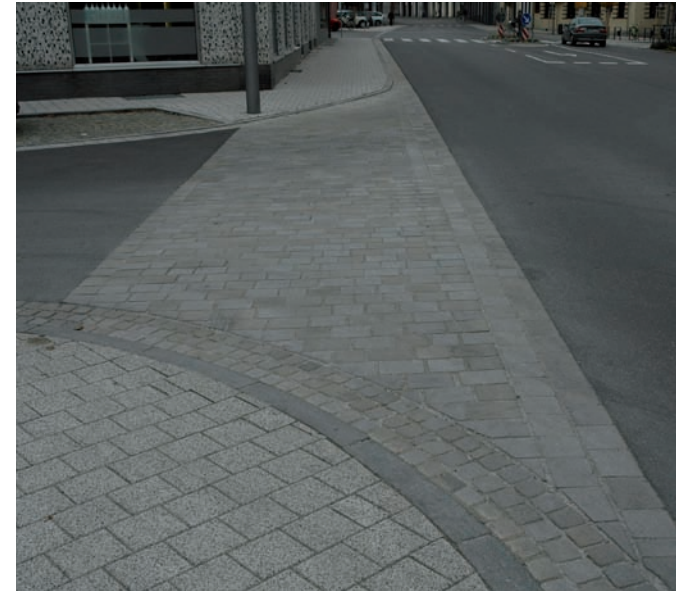
Ergänzung mit Granitgroßsteinpflaster gesägt