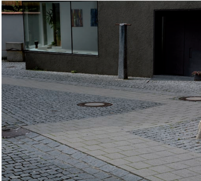
Straßengestaltung: Granitkleinsteinpflaster mit Betonpflasterband