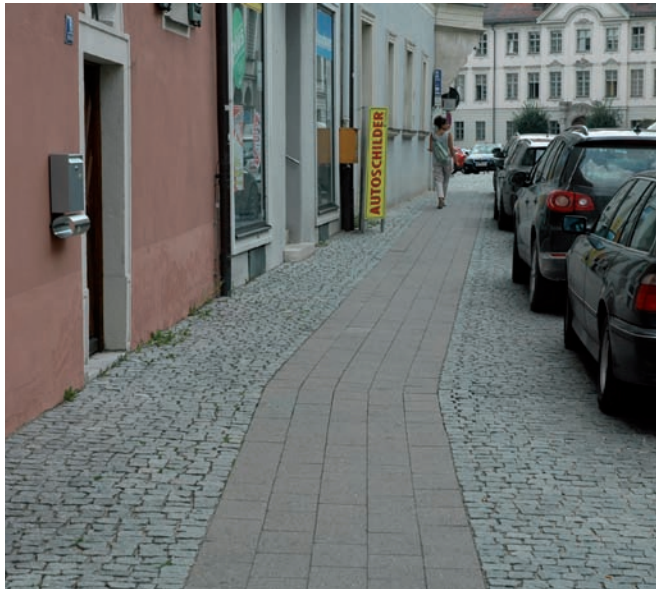
Verbindung mit Betonpflasterband