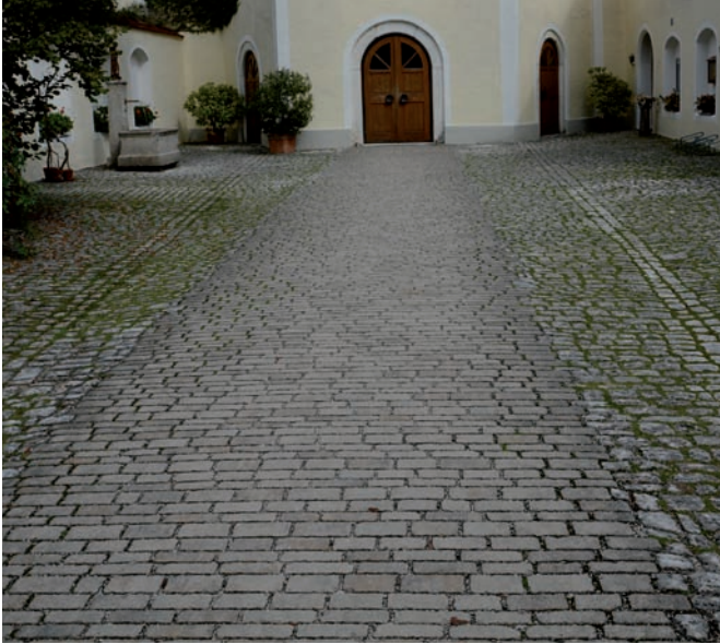
Verbindung mit Granitgroßsteinpflaster gesägt