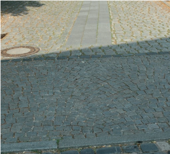
fehlende rollstuhlgerechte Verbindung