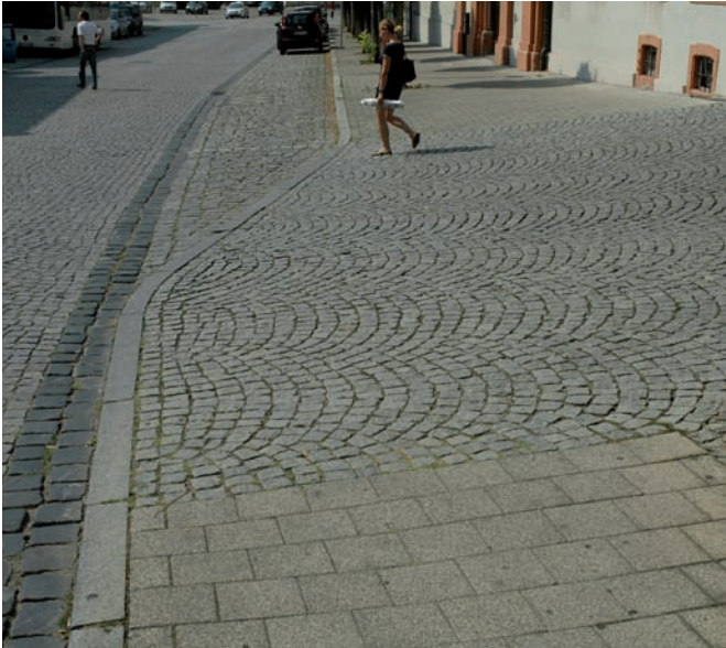
Fehlende rollstuhlgerechte Verbindung bei Ausfahrten