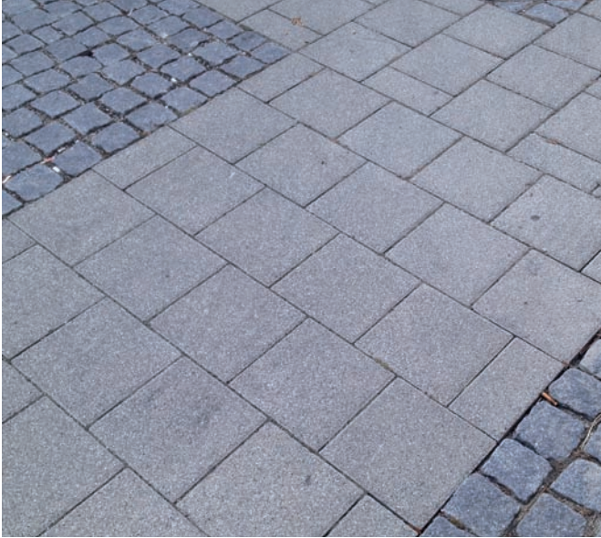
Betonplatten + Granitkleinsteinpflaster bruchrau