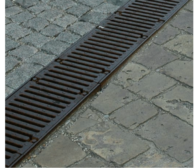
Rinne als Stolperfalle