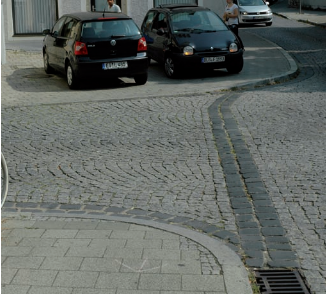
Hindernis durch Falschparker