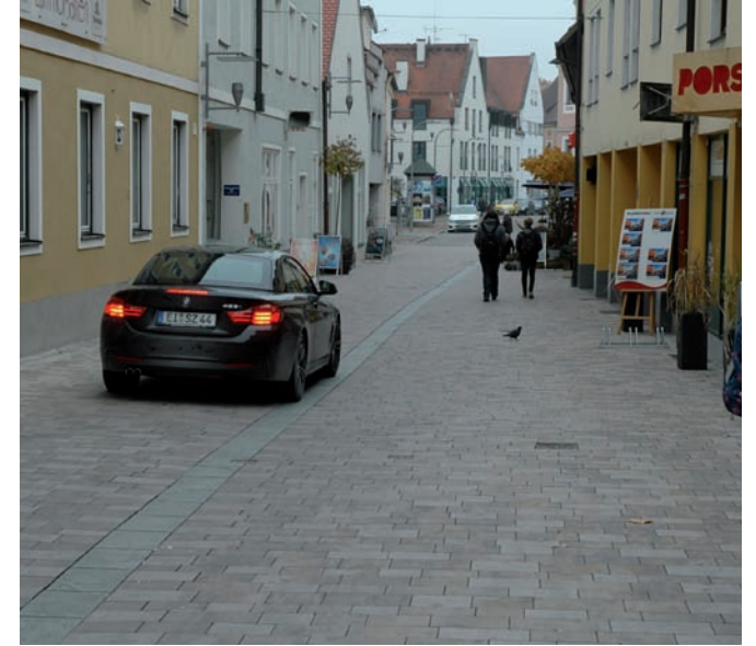
Straßenumgestaltung zur Mischfläche