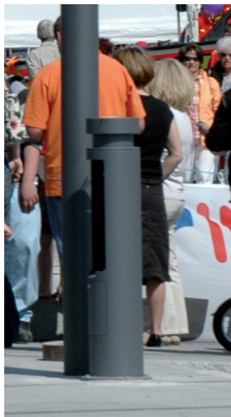
Versorgungs- / Energiesäulen