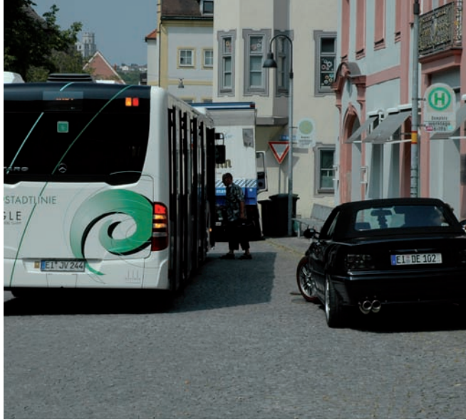
mangelhaft gestaltete Haltestellen