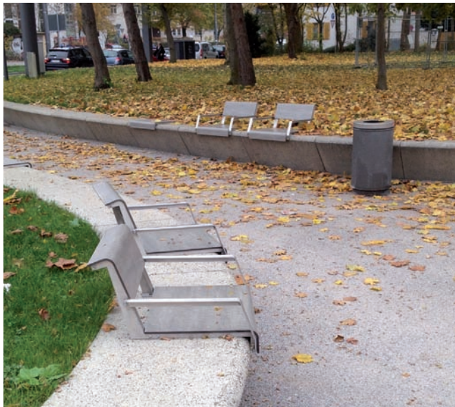
Sitzmöglichkeit mit Rücken- und Armlehne