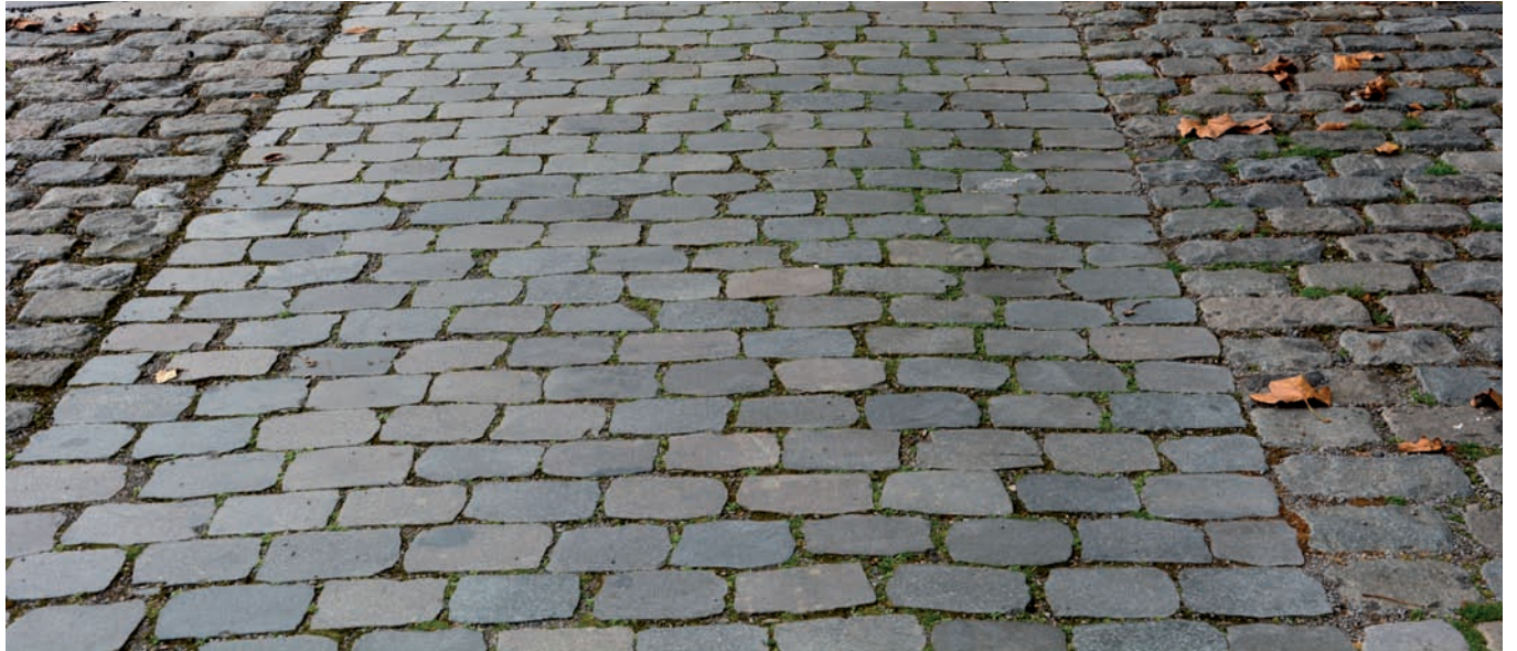
Verbindung mit gesägtem Großstein aus Bestand (Farbigkeit bewahrt)