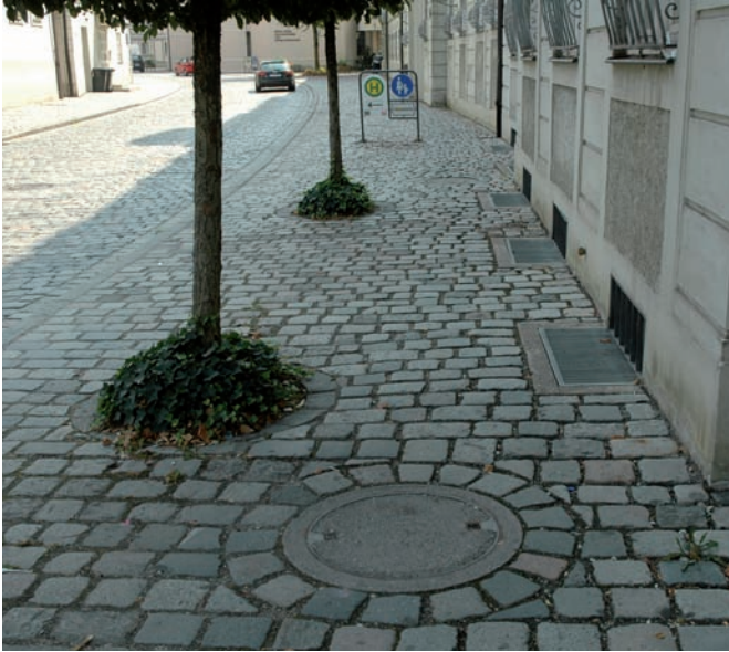
nicht rollstuhlgerechte Materialien