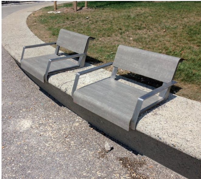
Sitzmöglichkeit mit Rücken- und Armlehne