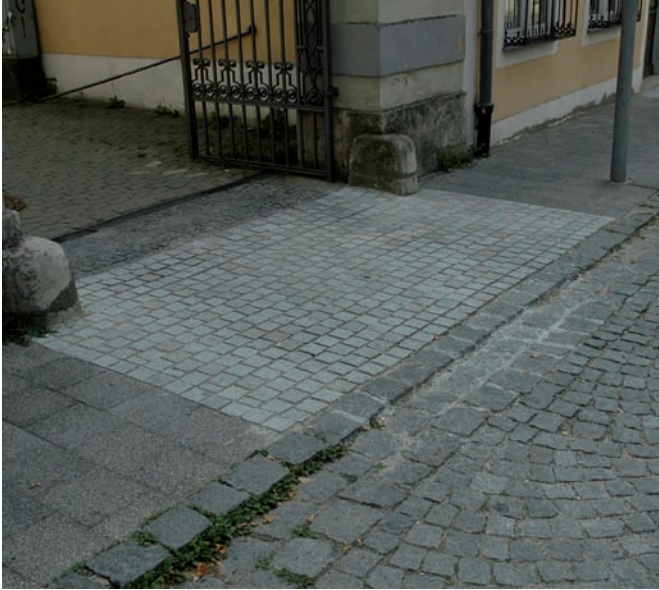
Ergänzung mit Granitkleinsteinpflaster gesägt