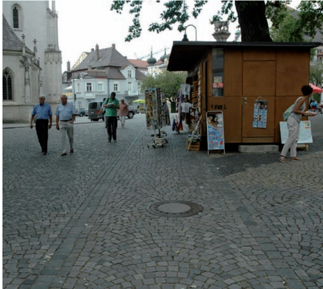
Warenauslage stört Wegebeziehung