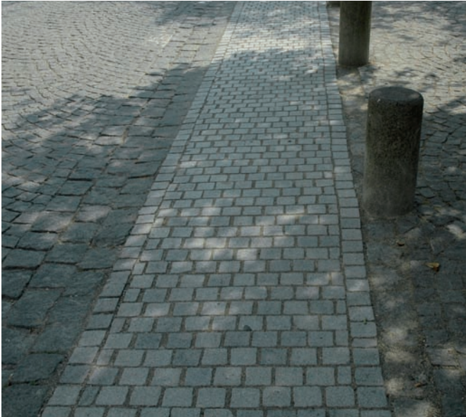
Verbindung mit Granitkleinsteinpflaster gesägt