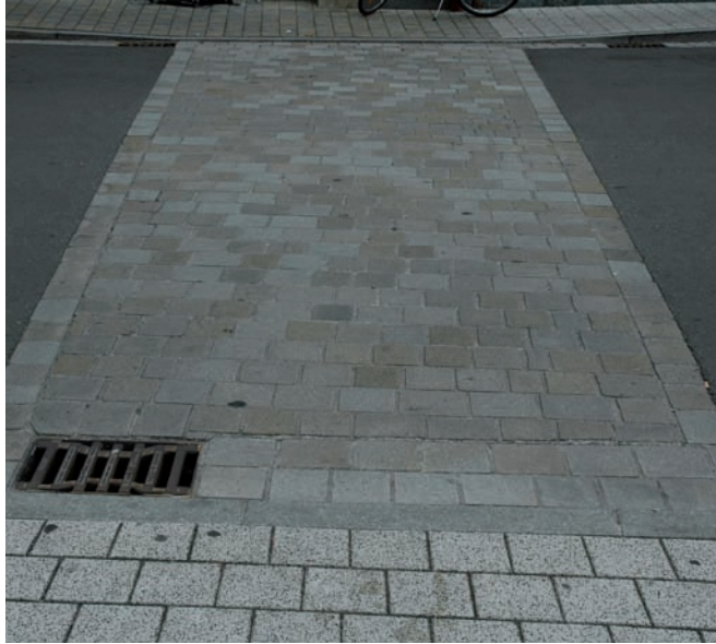
Querung mit Granitgroßsteinpflaster gesägt