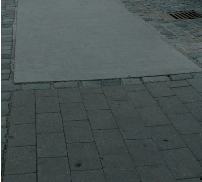
Betonplatten + Betonband