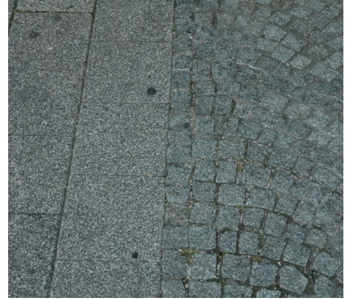
Betonplatten + Granitsteinpflaster Mosaik bruchrau