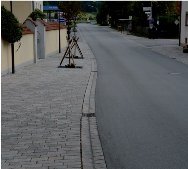
Straßenumgestaltung (Verkehrsarten getrennt)