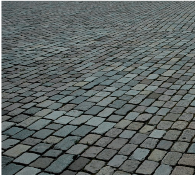
Granitgroßsteinpflaster bruchrau (abgefahren)