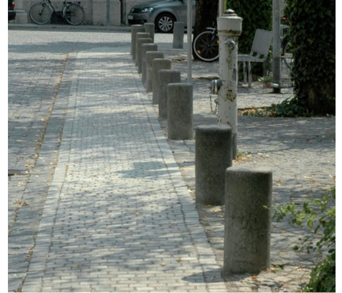
Parken verhindern durch Poller