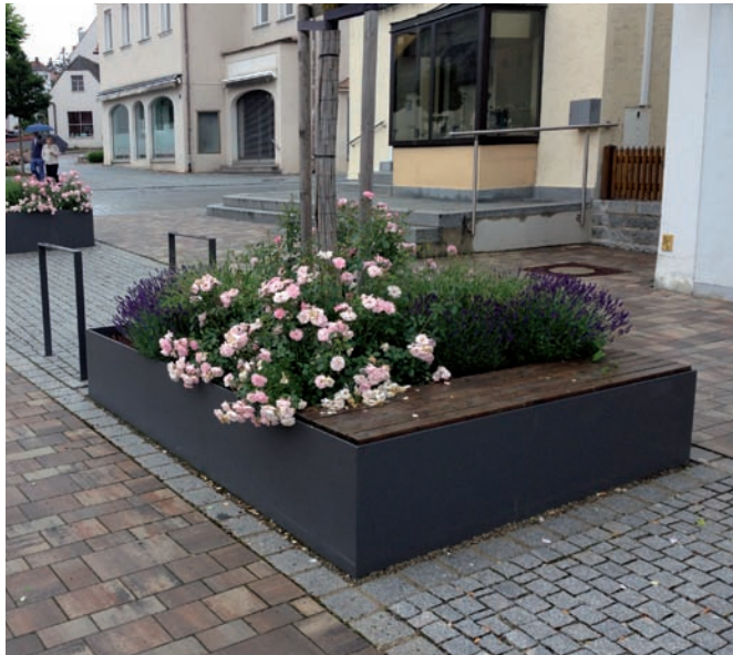
Pflanztrog groß mit Sitzmöglichkeit