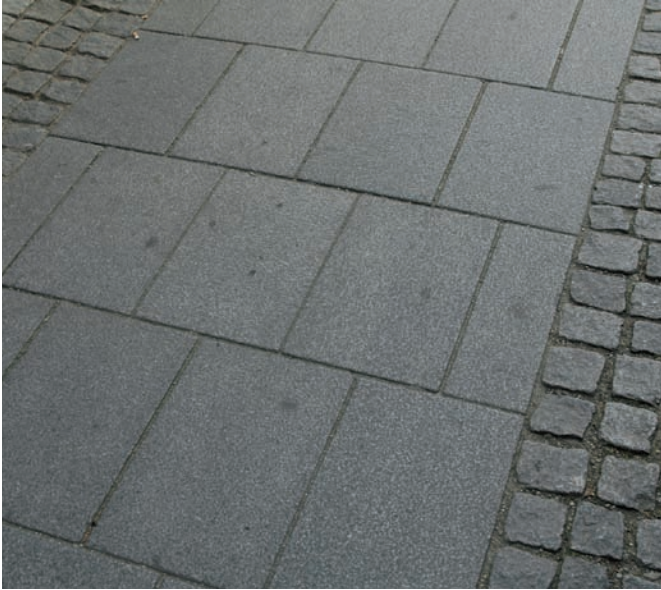
Granitplatten + Granitkleinsteinpflaster bruchrau