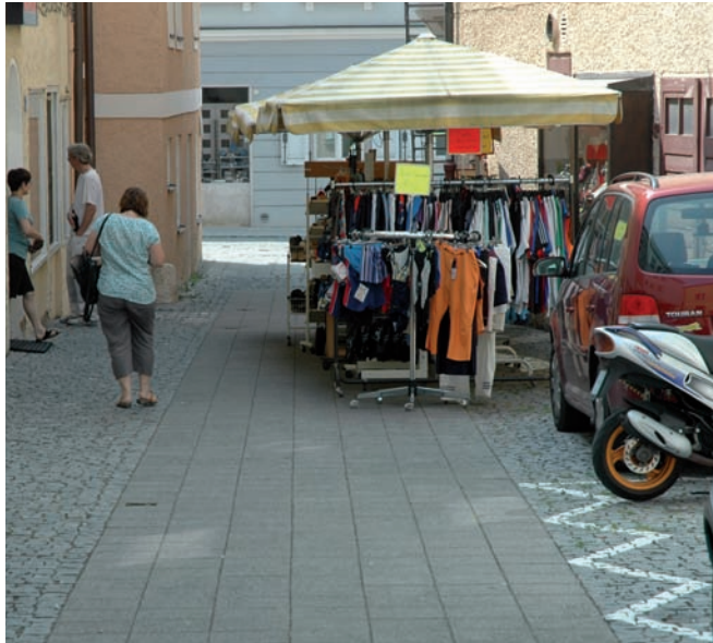
Hindernis durch Warenauslage