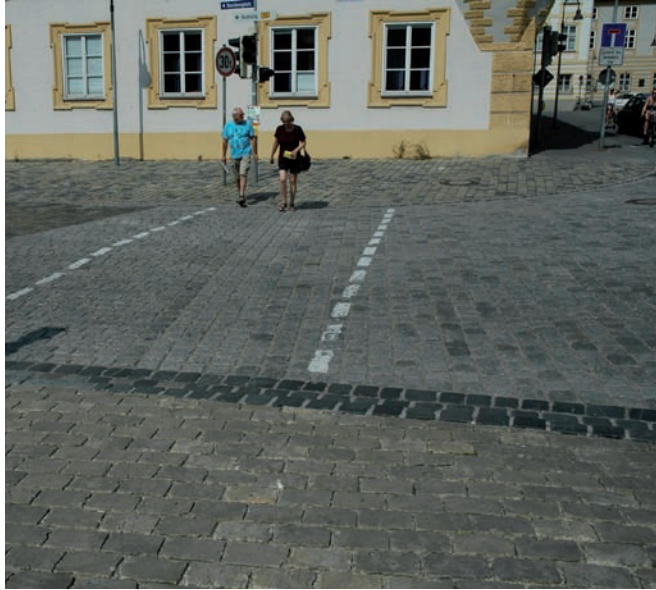
fehlende rollstuhlgerechte Querungsmöglichkeiten